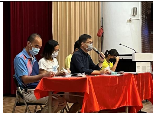
體育運動交流座談會 1