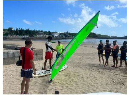
全英語授課教學觀摩與演練