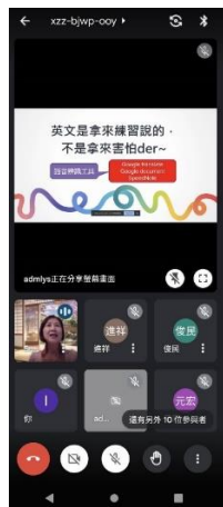
EMI 體育授課輕鬆談 2