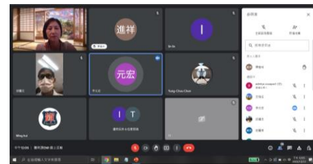
EMI 體育授課輕鬆談 1