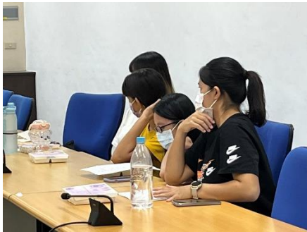
體育課雙語教學座談