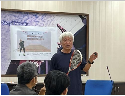
體育增能活動-壁球