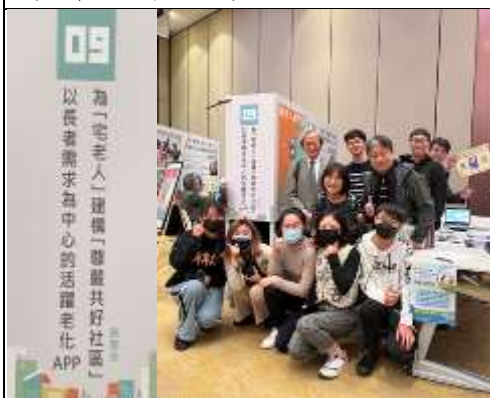
學生一同參與成果展