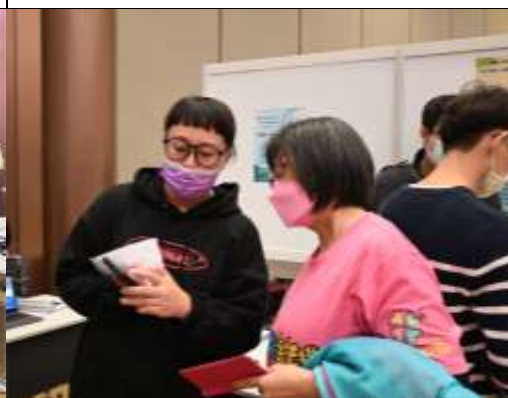
學生引導長者認識活躍老化 APP