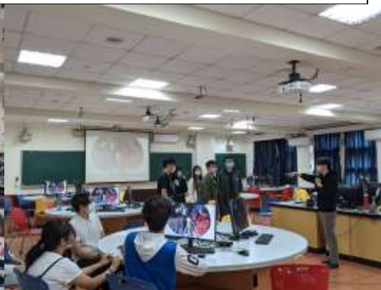
業師在互動中給予學生回饋